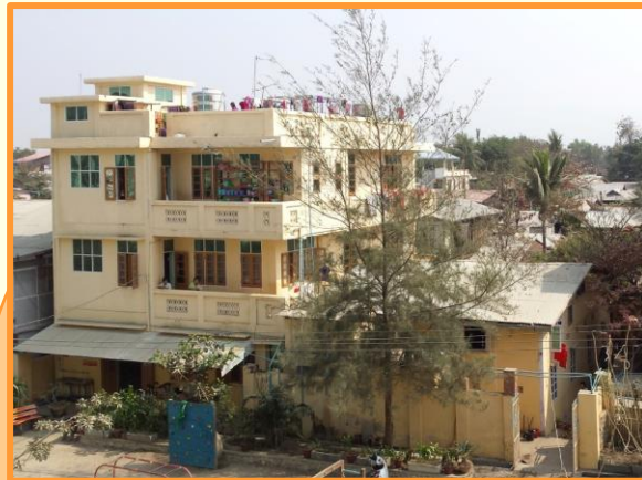
The Golden House, 1 van de 4 huizen

WCC heeft een bridging class opgezet: na hun eindexamen kunnen 200 jongeren Engelse lessen volgen om een Cambridge II of III diploma te halen. Verder volgen ze "life skill"-lessen zoals zelfbewustzijn, debat, kritisch denken etc.. Dit helpt hen enorm bij het aanvragen van beurzen en toegang krijgen tot vervolgstudies. In februari 2021 staat een werkbezoek gepland. Wanne come?