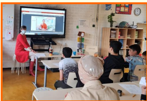
Vragen aan een novice in Myanmar

Myanmar: In Myanmar is de Indiase variant inmiddels het land binnengekomen. De effecten daarvan zijn niet bekend. Volgens WHO zijn er in totaal 3250 mensen aan corona overleden in Myanmar en er zijn 3 miljoen vaccinaties gezet. 2,3% van de bevolking is nu beschermd. Kinderen en staf die nog op het schoolterrein verblijven, mogen daar al sinds oktober niet van af. Zo is corona buiten de deur gehouden.