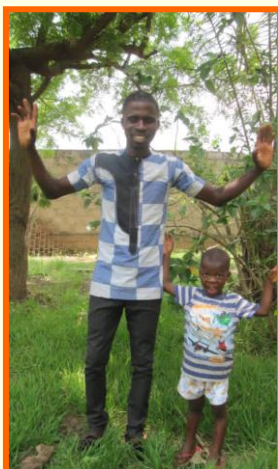
Komi (met kleine Amen)