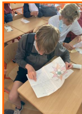
Leerlingen van het Herman Jordan Lyceum zijn blij met hun brief