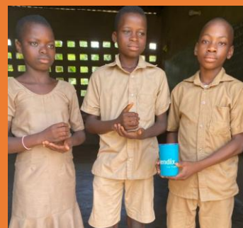
Amerikaanse doventaal voor "beker"