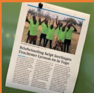
We stonden in de Drachtster Courant